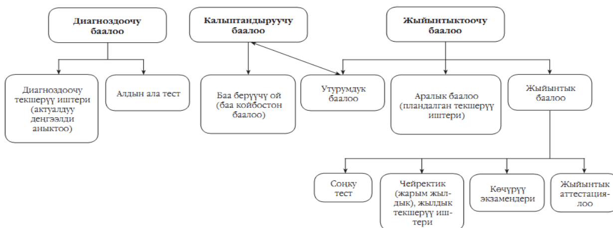
Схема: Баалоонун түрлөрү

Окуучулардын билим алуудагы жетишкендиктери менен өсүшүн өлчөө үчүн баалоонун үч түрү колдонулат: диагноздоочу, калыптандыруучу и жыйынтыктоочу (1-схема).